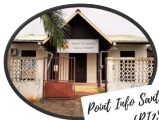
Point Info Santé et Social (PIS)